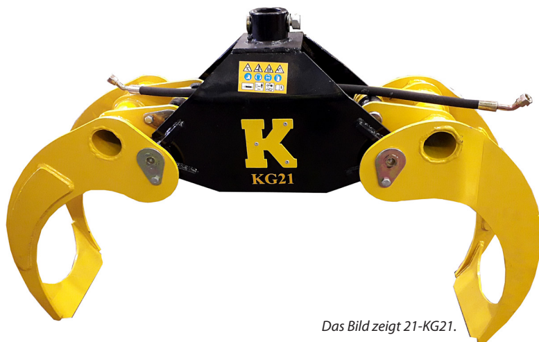
Das Bild zeigt 21-KG21.