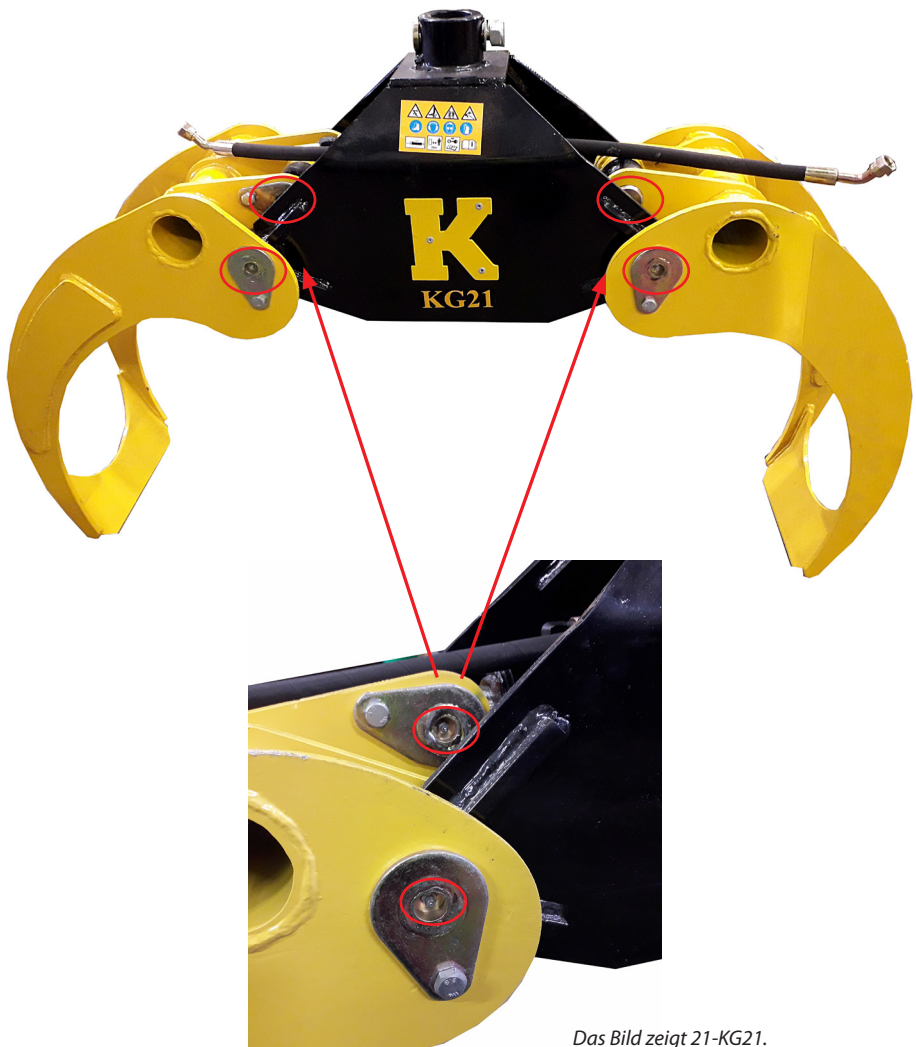
Das Bild zeigt 21-KG21.

Rechts und links befinden sich Schmiernippel. Sowohl an der Vorder- als auch Hinterseite.